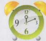
звук часового механизма