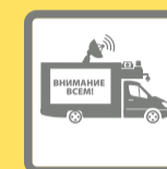
ПОДВИЖНЫЕ ЗВУКОУСИЛИТЕЛЬНЫЕ УСТАНОВКИ