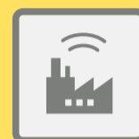
ГУДКИ ПРЕДПРИЯТИЙ И ТРАНСПОРТНЫХ СРЕДСТВ